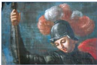
Retablo de San Jorge. (detalle)

El denominado Plan d'Erés , una amplia llanura que vierte suavemente hacia el río Gállego, constituye el entorno singular que rodea esta pequeña población del antiguo Reino de los Mallos. Esta zona, rica desde tiempo inmemorial en cereales y viñas, bien pudo ser puesta en cultivo por la civilización romana que, tal vez, se encuentre en el origen de la propia localidad compuesta por una sencilla estructura de cinco manzanas edificadas en torno a una plaza.