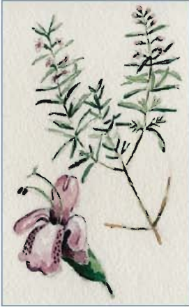
Romero (Rosmarinus officinalis L.)

De igual manera, nada más entrar a la plaza de la localidad, llama la atención el depósito de agua por su mural pintado popularmente en referencia a la campana de la iglesia y en contra de la construcción del pantano que acabaría con la existencia misma de la localidad.