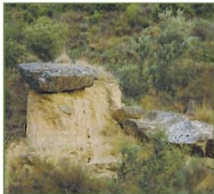
Chimenea de hadas (junto al barranco)