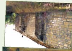
Entrada y lateral de la ermita

Por su localización en un lugar elevado al Norte del pueblo y cerca de las tierras de cultivo, desde esta ermita se realizan, todavía hoy, misas y ritos protectores contra las tormentas y propiciadores de la fertilidad.