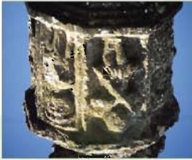
Detalles de la cruz de la balza

La presencia de las cruces a la entrada y salida de los pueblos es una forma de proteger a los mismos de plagas y males, al igual que las invocaciones y símbolos en las puertas de las casas protegen a sus integrantes.