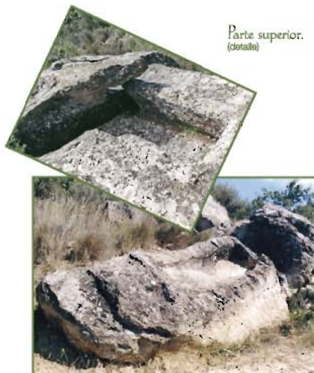
Parte superior. (detalle)

Este paseo puedes hacerlo a pie o en bici de montaña y si te apetece, puedes ampliarlo hasta llegar a Piedramorrera (tiempos añadidos en el mapa entre paréntesis).